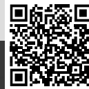
Salvador De Frías Quijano Group